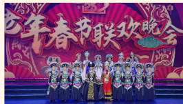
老年春节联欢晚会

公司联合《多彩芳华》专区，持续深化IPTV适老化改造，推出便携老人机终端，解决老年群体“用机难”问题；推广“乐享派”中屏智能终端252台，开展AI数字人培训，推动数字普惠服务落地；承办2025全国老年春晚贵州选区选拔活动，吸引全省100余支队伍、近2200名中老年文艺爱好者参与，4支队伍代表贵州进京录制并在央视播出，触达全国银发人群超3亿人次；举办“高寨之约·漫步神韵”登高联谊、中老年校友见面舞会等活动，服务中老年群体超300人次；开展8场适老化家居主题宣讲，深入乡村进行敬老慰问与文艺展演，不断丰富老年精神文化生活，提升老年群体获得感与幸福感。