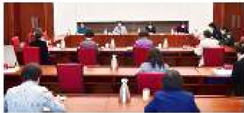
【日照动态】日照市乡村振兴工作推进会议在日照市乡村振兴局召开，会议围绕乡村振兴重点工作，安排部署了下一阶段工作，要求各地各部门要深入贯彻落实中央和省市委决策部署，扎实推进乡村振兴各项工作，为全面建设社会主义现代化国家开好局起好步作出更大贡献。

日照市乡村振兴工作推进会议在日照市乡村振兴局召开，会议围绕乡村振兴重点工作，安排部署了下一阶段工作，要求各地各部门要深入贯彻落实中央和省市委决策部署，扎实推进乡村振兴各项工作，为全面建设社会主义现代化国家开好局起好步作出更大贡献。