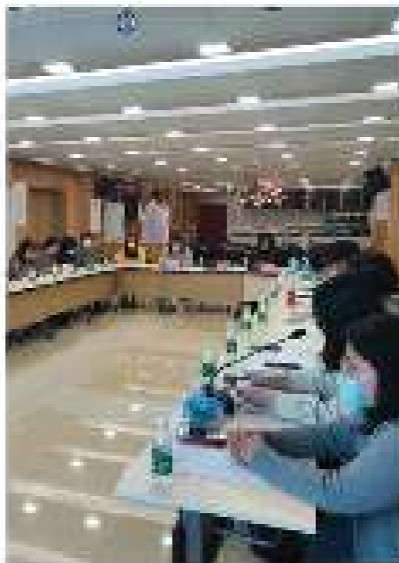
上海城市精神研究中心联合各区开展普及型村（居）党组织书记轮训工作

为提升村居党组织书记专业化、专业化水平，提升村居党组织书记队伍整体素质，在上海市“万名书记进党校”培训的基础上，上海城市精神研究中心联合各区开展普及型村（居）党组织书记轮训工作，通过集中培训、实地观摩、交流研讨等方式，全面提升村居党组织书记的综合素质和履职能力。