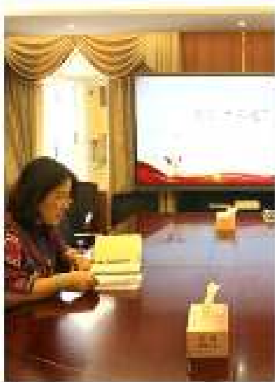
上海“三强”项目启动：村居党组织书记轮训

11月10日，上海城市精神研究中心联合各区开展普及型村（居）党组织书记轮训工作，在浦东新区川沙新镇开展轮训工作，通过集中培训、实地观摩、交流研讨等方式，全面提升村居党组织书记的综合素质和履职能力。