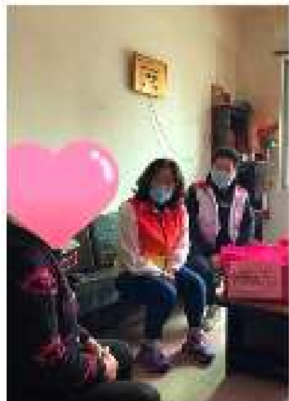
上海城市精神研究中心对全市各区开展普及型村（居）党组织书记轮训工作

为进一步提升村居党组织书记专业化、专业化水平，提升村居党组织书记队伍整体素质，在上海市“万名书记进党校”培训的基础上，上海城市精神研究中心联合各区开展普及型村（居）党组织书记轮训工作，通过集中培训、实地观摩、交流研讨等方式，全面提升村居党组织书记的综合素质和履职能力。