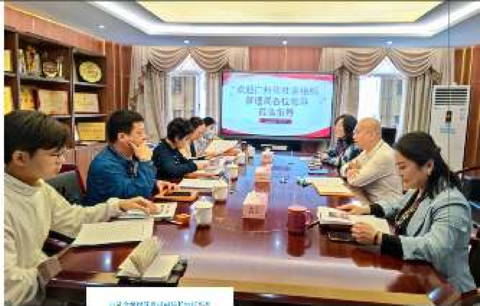
自治区残联等社会组织与自治区残联 广西康复中心项目合作签约仪式