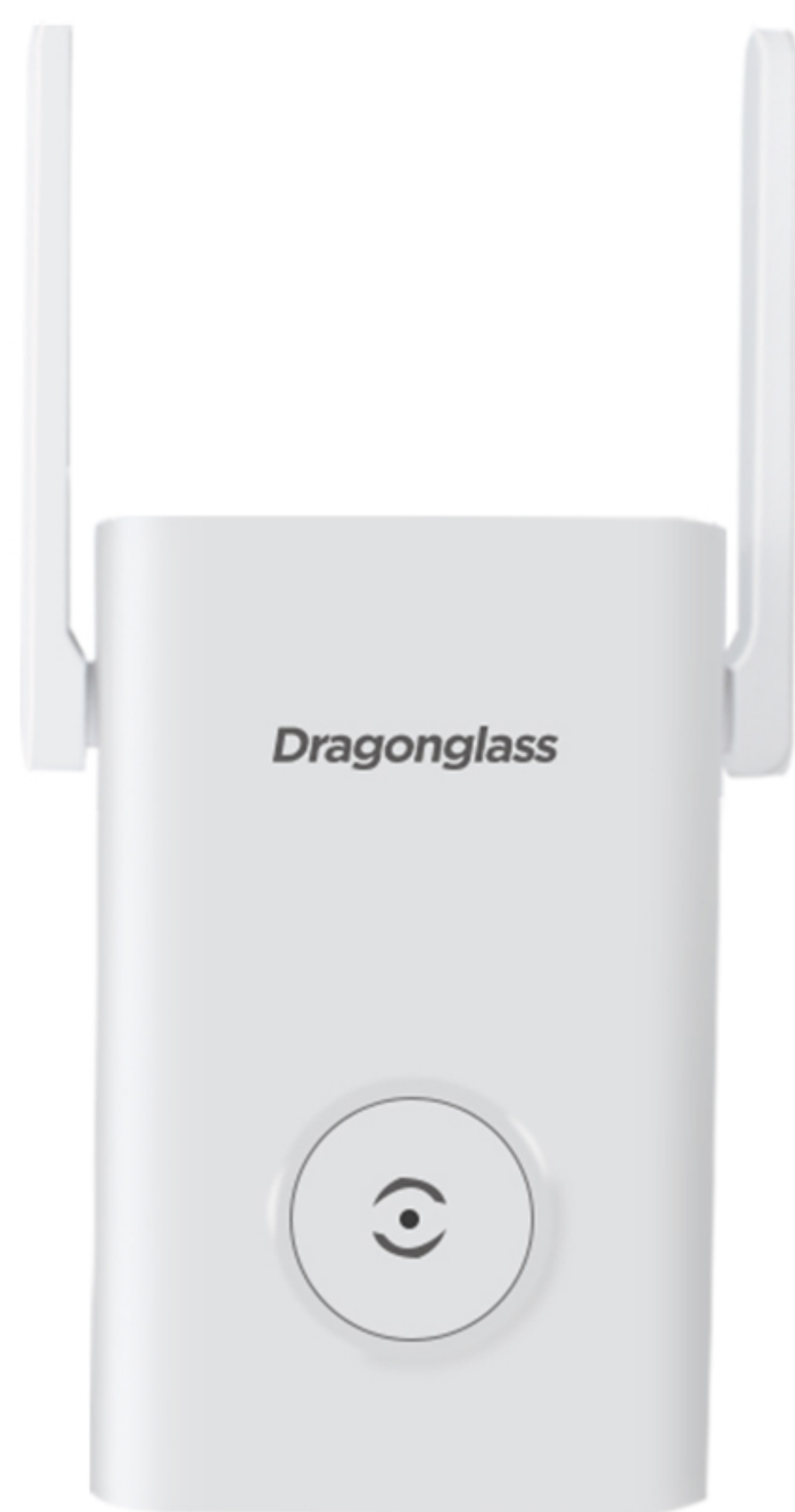
DGE1 WIFI5 中继器

DGE1 千兆 WIFI5 中继器是龙晶科技（深圳）有限公司全新设计的中继器，主要为满足家庭组网覆盖需求。DGE1 采用WIFI5(802.11AC)无线协议技术,整机提供 1200M 无线速率，采用 2 路高增益外置天线设计。覆盖范围更大更灵活，满足各种户型需求，支持多种加密方式，支持一键配网，让您的使用更加安全，更加简单！ DGE1 中继器，“立”所能及,效果立竿见影！ 王者，重现江湖！